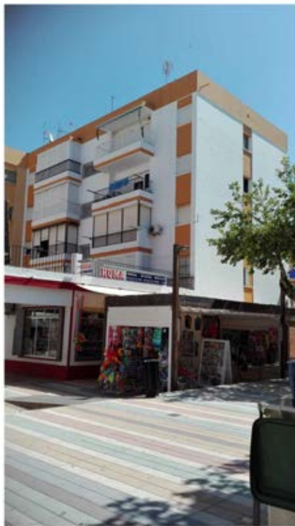
Reconstrucciones de Balcones.